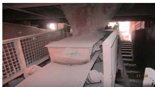
شکل ۴. طراحی و اجرای نامناسب پرده گردوغبار

در انتهای نوار نقاله‌ها برای جلوگیری از فرار آلاینده باید پارچه یا ورق پلاستیکی نصب شده باشد. این پارچه یا نوار باید با سطح مواد روی نوار حداکثر ۵ فاصله داشته باشد. نتایج نشان می‌دهد از مجموع ۱۵ هود، بر اساس استانداردهای بررسی شده، ۹ هود به پرده لاسیتکی گردوغبار نیاز نداشتند. هودهای ۱۰، ۱۲، ۱۵، ۱۶، ۱۷ به پرده گردوغبار نیاز دارند (جدول ۷). از آن جایی که هود شماره ۴ بعد از محل ریزش ذرات درشت از سرند روی نوار بوده و بر روی نوار نقاله ۲۳ طراحی شده است، برای آن پرده گردوغبار به صورت صحیح طراحی گردیده