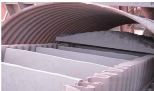
شکل ۳. محل ریزش مواد از نوار ۲۱ بر روی نوار ۲۲

هم چنین نتایج بررسی‌های آماری توصیفی نشان داد که در موقعیت‌های انتشار آلاینده و ریزش مواد بر اساس توصیه‌های استاندارد به‌طور متوسط ۲ هود نیاز است در حالی که در وضعیت موجود و طراحی، تقریباً نیمی از آن قرار دارد (جدول ۵). از آن جا که پایش و ارزیابی به عنوان مبنا برای سیستم