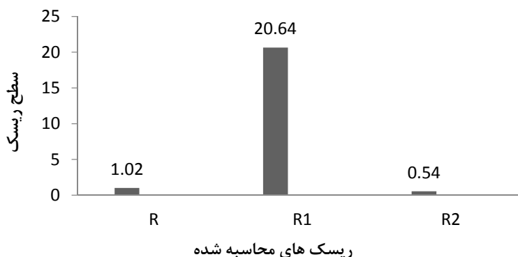
شکل ۲. سطح ریسک برای ساختمان و محتویات ( R )، ساکنین ( R_1 ) و فعالیت ها ( R_2 ) در وضعیت موجود

در این پژوهش از روش ارزیابی مهندسی ریسک حریق FRAME، جهت تعیین کمی ریسک حریق ساختمان، فعالیت ها و ساکنین اتاق کنترل استفاده شد. نتایج نشان می دهد، ریسک حریق برای ساکنین ( R_1 )، با میزان ۲۰/۶۴ بالاترین سطح را دارد. ریسک حریق ساختمان و محتویات ( R ) نیز ۱/۰۲ به دست آمد. از آن جا که مطابق راهنمای روش FRAME، سطح ریسک قابل قبول کم تر از ۱ می باشد، لذا ریسک حریق ساکنین و ساختمان و محتویات در این پژوهش در