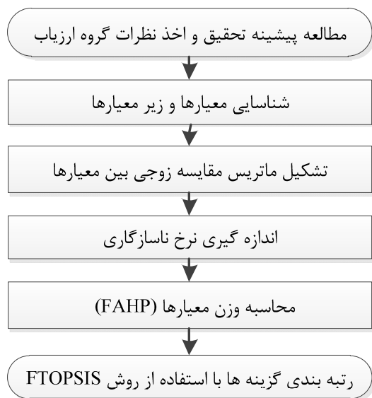
شکل ۱. چارچوب روش پیشنهادی

با توجه به افزایش و رشد پروژه‌های بلندمرتبه‌سازی و خطرات ویژه این نوع ساخت‌وسازها، ارزیابی فرهنگ ایمنی در کارگاه‌های بلندمرتبه‌سازی از اهمیت و ضرورت به‌سزایی برخوردار است. بنابراین کارگاه مورد مطالعه، یک برج اداری-تجاری ۳۳ طبقه فولادی است که در مرحله اجرای اسکلت فلزی و سفت‌کاری قرار داشته و بخشی از یک مگا پروژه تجاری-اقامتی و اداری با زیربنای کل حدود ۶۰۰،۰۰۰ مترمربع محسوب می‌شود. در شکل ۱ جزئیات روش پیشنهادی رتبه‌بندی مشاغل در کارگاه‌های بلندمرتبه‌سازی از نظر فرهنگ ایمنی با استفاده از مدل FTOPSIS-FAHP نشان داده شده است.