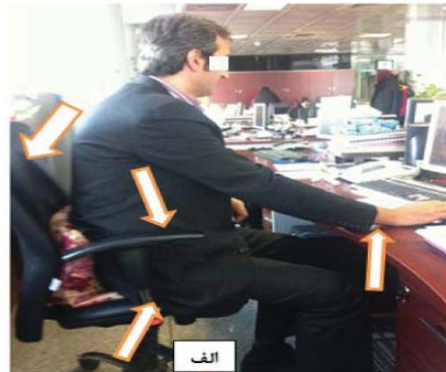
شکل ۱. تاثیر صندلی بر پوسچر شاغلین - الف) قبل از مداخله ب) بعد از مداخله