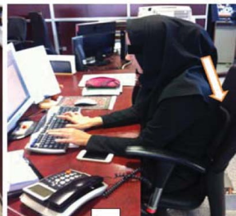
شکل ۲. اثر استفاده از پشتی حمایتی بر پوسچر شاغلین - الف) قبل از مداخله ب) بعد از مداخله

نیازمند کلیه یا قسمتی از این مداخلات تشخیص داده شده بودند اجرا گردید. نمونه‌ای از مداخلات انجام پذیرفته در شکل ۱ و ۲ ارایه گردیده است.