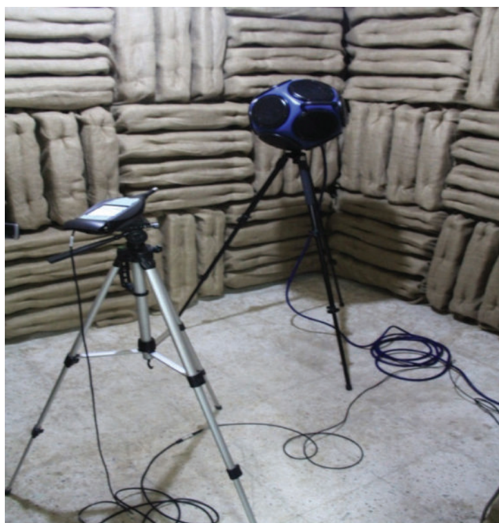
شکل ۱: ست اندازه‌گیری زمان بازآوایی به روش صدای منقطع

قبل از کار با نرم افزار زمان بازآوایی مورد هدف، سطح جذب مورد هدف و سطح کلی مورد هدف در فرکانس معین شده به منظور طراحی با نرم افزار، تعیین گردید.