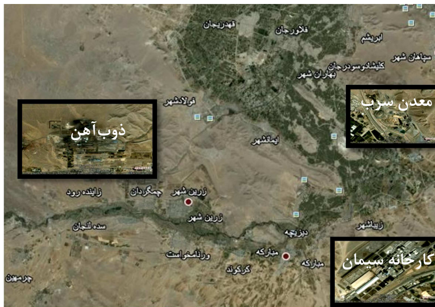
شکل ۱: اراضی منطقه مورد مطالعه

در بالن ژوژه ۵۰ mL جمع‌آوری و توسط دستگاه جذب اتمی مدل پرکین المر (Atomic Absorption) Perkin Elmer 3030 غلظت فلزات سنگین کادمیوم و سرب تعیین گردید (۱۷). توصیف آماری داده‌ها با استفاده از نرم‌افزار Statistica نسخه ۶ صورت گرفت. همچنین مقایسه میانگین‌ها با آزمون LSD انجام شد.