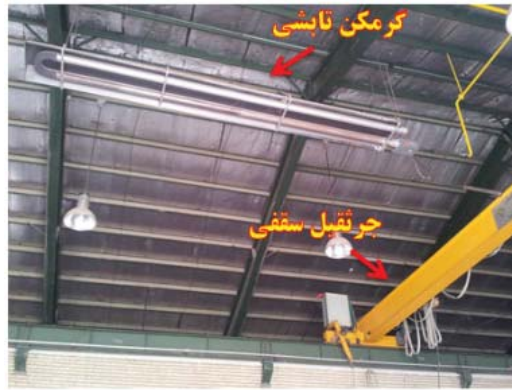
شکل ۱: تصویری از گرمکن تابشی و موقعیت آن نسبت به جرثقیل سقفی در کارگاه شماره یک

استفاده گردید. برای سنجش سرعت جریان هوا از دماسنج کاتای نقره اندود استفاده شد. متابولیسیم افراد با توجه به نوع فعالیت و شغل آنها، توسط استاندارد ASHRAE 55-2004 محاسبه گردید. جهت محاسبه کلوی لباس نیز براساس نوع پوشش افراد از استاندارد ASHRAE 55-2004 استفاده شد (ASHRAE Standard 55, 2004). جهت تعیین آسایش حرارتی به روش عینی بر اساس مقادیر پارامترهای محیطی از طریق روابط ۱، ۲، ۳، و ۴ شاخص PMV و از طریق رابطه ۵ شاخص PPD محاسبه شد (ISO 7730, 2005).