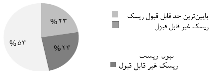
نمودار ۱: درصد ریسک‌های شناسایی شده قبل از مداخله

همچنین درصد ریسک‌های بعد از انجام مداخله به ۶۱ درصد در محدوده ریسک قابل قبول و ۳۹ درصد در محدوده پایین‌ترین حد ریسک قابل قبول تغییر یافت. نتایج در قالب نمودار ۲ مشخص می‌باشد: