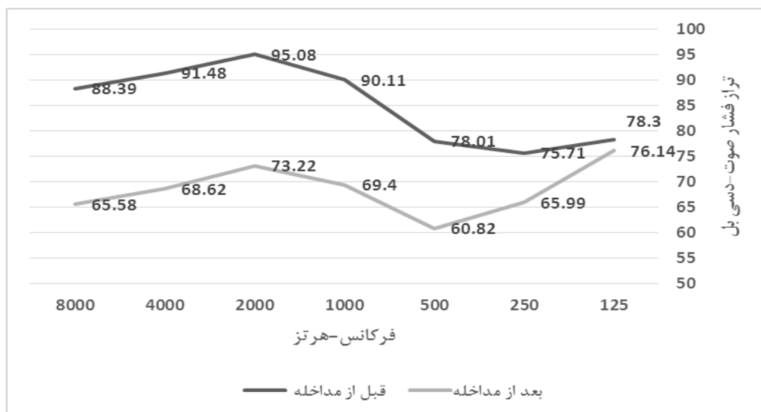
شکل ۳: مقایسه تراز فشار صوت منبع قبل و بعد از مداخله در فرکانس‌های اوکتاوی