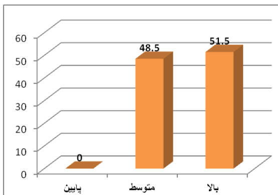
نمودار ۲- توزیع فراوانی سطوح حمایت اجتماعی در کارکنان مراکز بهداشتی درمانی شهرستان یزد

بر اساس یافته‌ها میانگین فرسودگی شغلی در بعد کفایت شخصی 8.726 \pm 31.788 (از مجموع نمره ۴۸)، در بعد خستگی هیجانی 12.624 \pm 26.53 (از مجموع نمره ۵۴) و در بعد مسخ شخصیت 5.444 \pm 0.70 (از مجموع نمره ۳۰) به دست آمد. به عبارت دیگر با توجه به خطوط برش پرسشنامه مازلاک، افراد مورد پژوهش در بعد کفایت شخصی و مسخ شخصیت در حد پایین و در بعد خستگی هیجانی در حد متوسط بودند (جدول ۱).