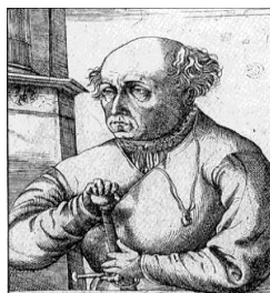
شکل ۱۰- پاراسلسوس

تئوفراستوس بومباستون فون هونهنه‌ایم (Theophrastus Bombastus von Hohenheim) (شکل ۱۰)، معروف به پاراسلسوس نظریه «دوز سم می‌سازد» را ابراز کرد، یعنی هر ماده‌ای سم است، دوز صحیح سم را از دارو جدا می‌کند.