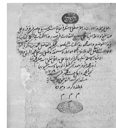
شکل ۵- تصویر صفحه اول کتاب الحاوی