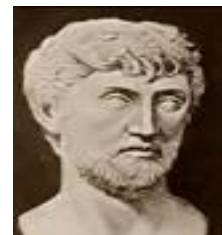
شکل ۲- تصویر منتسب به لوکرتیوس

لوکرتیوس که فیلسوفی در علوم طبیعی بود (شکل ۲) در مورد معدن‌کاران نوشت (۱،۸): «آیا نمی‌بینید که آنها پس از دوره‌ای کوتاه نیروی حیاتی‌شان تحلیل می‌رود و هلاک می‌شوند؟»