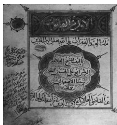
شکل ۷- تصویر صفحه اول نسخه اصلی کتاب قانون فی الطب

"علل فاعلی موجبات و عواملی است که تن آدمی را نگه می‌دارند و یا تغییر می‌دهند مانند هوا و متعلقات آن، غذاها، آب‌ها، آشامیدنی‌ها، تخلیه، احتقان، احتباس، محیط زیست، مسکن، فعالیت و استراحت، خواب، بیداری، تغییرات سنین عمر، جنسیت، پیشه، عادات، حرکات بدنی و چیزهای دیگری که با تن آدمی در تماس هستند و با طبیعت سازگار یا ناسازگارند.