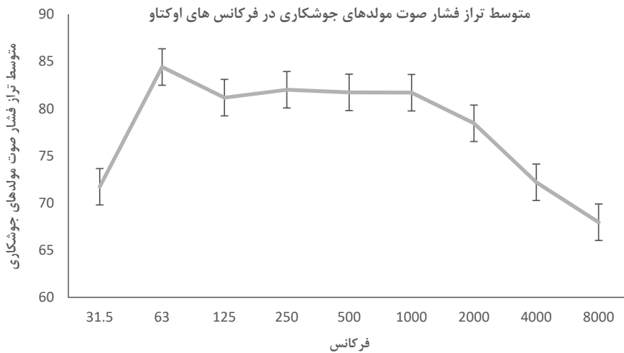
شکل (۲) - متوسط تراز فشار صوت مولد های جوش کاری در فرکانس های اوتکت

که در شرایط خاموش بودن مولد های دیزلی اندازه گیری شده بود، از حدود مجاز سازمان محیط زیست (۵۵ دسی بل در طی ساعات ۸ صبح الی ۱۰ شب) تجاوز کرده بود و این تجاوز از حدود مجاز به دلیل صدای ناشی از ترافیک و تردد خودروها در اطراف سایت های ساخت و ساز بود. (جدول ۱) لذا با توجه به صدای زمینه موجود، حتی در شرایطی که مولدهای دیزلی خاموش هستند صدا از حدود مجاز سازمان محیط زیست تجاوز خواهد کرد و در صورت استفاده از استاندارد موجود سازمان محیط زیست ارزیابی صحیحی از صدای ناشی از مولد های دیزلی صورت نخواهد گرفت. در این مطالعه، حدود مجاز صدای محیط زیستی با اقتباس از استاندارد BS 5228 (صدای زمینه به اضافه ۵ دسی بل) بر اساس صدای زمینه موجود در هریک از سایت های ساخت و ساز به دست آمد، لذا هریک از سایت های ساخت و ساز حدود مجاز مختص به خود را خواهد داشت. متوسط تراز صدای زمینه در ۱۴ سایت ساخت و ساز بررسی شده در این مطالعه ۴۶/۲۰ دسی بل اندازه گیری