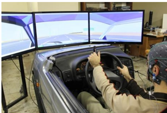
شکل ۱- تصویر شبیه ساز رانندگی به کار رفته برای ردیابی خستگی ذهنی راننده.

در این پژوهش به منظور بررسی خستگی ذهنی راننده از دستگاه شبیه ساز رانندگی با سکوی ثابت (مدل CI004 Semi) مبتنی بر واقعیت مجازی (Virtual-reality driving simulator) در یک اتاق آرام کنترل شده از لحاظ دما و صدا و دارای روشنایی ثابت استفاده شد. این شبیه ساز توسط گروه مکترونیک دانشگاه خواجه نصیر طوسی طراحی و ساخته شد (شکل ۱). در مرحله بعد سناریوی جاده یکنواخت به طول ۱۱۰ کیلومتر طراحی و شبیه سازی شد. ۹۰ کیلومتر ابتدایی جاده، یکنواخت و مستقیم با حداقل اجزای کناری برای القای بیشتر خستگی و ۳۰ کیلومتر انتهایی جاده‌ای پر پیچ و خم و کوهستانی بود (شکل ۲). جاده مورد نظر براساس پرمخاطره ترین جاده های موجود در کشور از طریق نقشه گوگل عکس برداری و با نرم افزارهای civil 3D (نسخه ۲۰۱۳) و 3D Max (نسخه ۲۰۱۲) طراحی گردید.