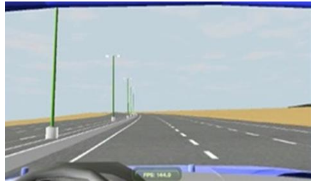
شکل ۲- عکس گرفته شده از صفحه نمایش LCD شبیه ساز رانندگی.

پیش از شروع آزمایش، گرایش به خواب آلودگی رانندگان با استفاده از مقیاس خواب آلودگی اپ ورث (Epworth Sleepiness Scale=ESS) سنجیده شد و با شروع آزمایش در هر ۱۰ دقیقه سطح خستگی ذهنی آن ها با مقیاس خواب آلودگی کرولینسکا (Karolinska Sleepiness Scale=KSS) (۹ امتیازی (۱ برای کاملاً هوشیار و ۹ برای خیلی خواب آلود) توسط خود شرکت کنندگان از طریق نمایش در روی صفحه نمایش ارزیابی شد (خود ارزیابی خستگی). سپس در حالی که در آرامش روی صندلی نشسته بودند، ثبت های EEG برای بررسی سیگنال