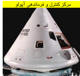
مرکز کنترل و فرماندهی آپولو