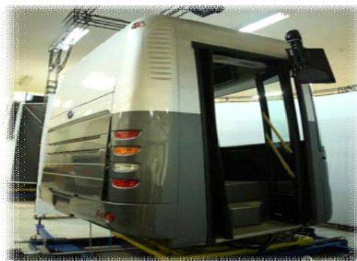
شکل ۳- شبیه‌ساز رانندگی اتوبوس آکیا Full 301 BI