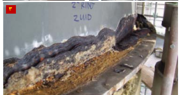
(۱) و (۲) - نمونه هایی از عایق آسیب دیده