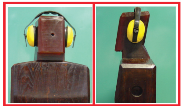
تصویر ۲: نمای آداپتور ساخته‌شده و چگونگی قرار گرفتن حفاظ رو گوشی روی سر

در جدول ۳ نتایج میانگین کاهندگی عملیاتی گوشی‌ها در محیط کار و با شرایط واقعی ارائه گردیده است. نتایج به دست آمده از این روش نشان می‌دهد که کمترین کاهندگی مربوط به حفاظ رو گوشی Bilsonم زرد و بیش‌ترین کاهندگی مربوط به گوشی حفاظ رو گوشی Brookland می‌باشد.