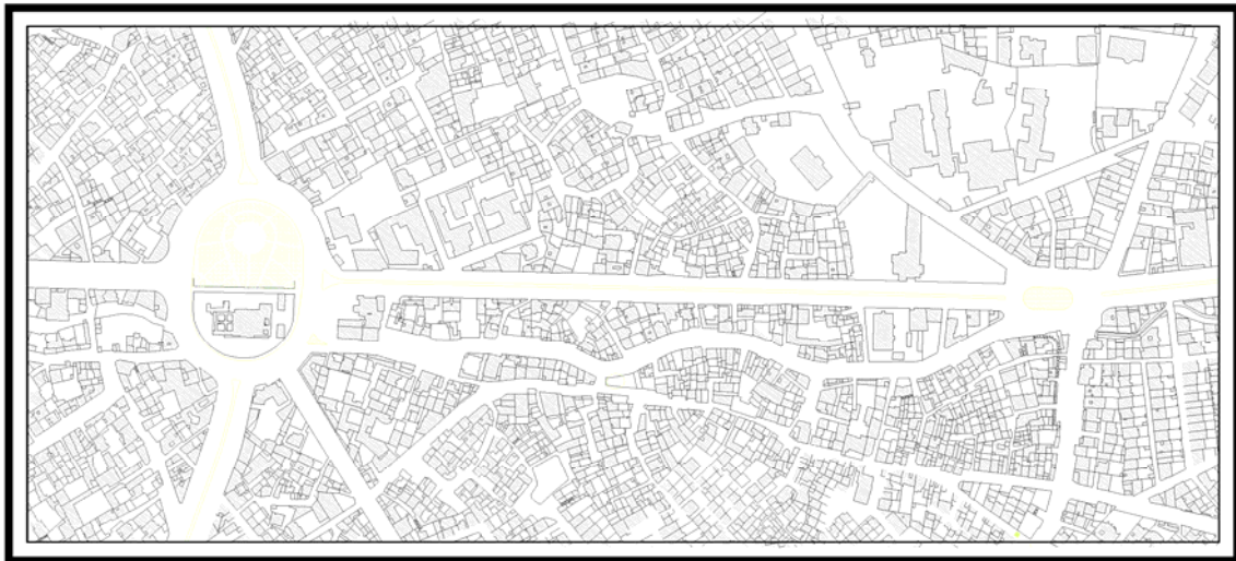
تصویر ۱- طول مسیر استقرار برج حد فاصل میادین بوعلی سینا و جهاد سازندگی