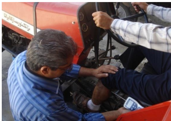
شکل ۱- استفاده از دستگاه الگومتر در ناحیه عضله گاستروکنیمیوس برای تعیین آستانه درد

درد کاربر در این مرحله نیز ثبت شد. کاهش آستانه درد عبارت است از: آستانه درد قبل از کلاچ‌گیری منهای آستانه درد کاربر بعد از کلاچ‌گیری. کاهش هر چه بیش‌تر آستانه درد نشان می‌دهد که عضله در فرآیند کلاچ‌گیری تحت تنش بیش‌تری قرار گرفته است. تمامی اندازه‌گیری‌ها با رعایت فواصل زمانی مناسب بین آزمایش‌های مختلف صورت گرفت. با توجه به این‌که کلاچ تراکتور MF285 دو مرحله‌ای است، برای جلوگیری از خطای احتمالی، با قرار دادن مانع فلزی زیر پدال از اعمال نیروی مازاد و رفتن به مرحله دوم کلاچ‌گیری جلوگیری شد. در تحلیل رگرسیونی مورد استفاده، تأثیر متغیرهای مستقل شامل: شاخص BMI، زاویه زانو، زاویه مچ و ران پا (به ترتیب X_1 ، X_2 ، X_3 و X_4 ) بر کاهش آستانه درد به‌عنوان متغیر وابسته (Y) بررسی شد. داده‌ها با استفاده از نرم‌افزار JMP4 تجزیه و تحلیل شدند.