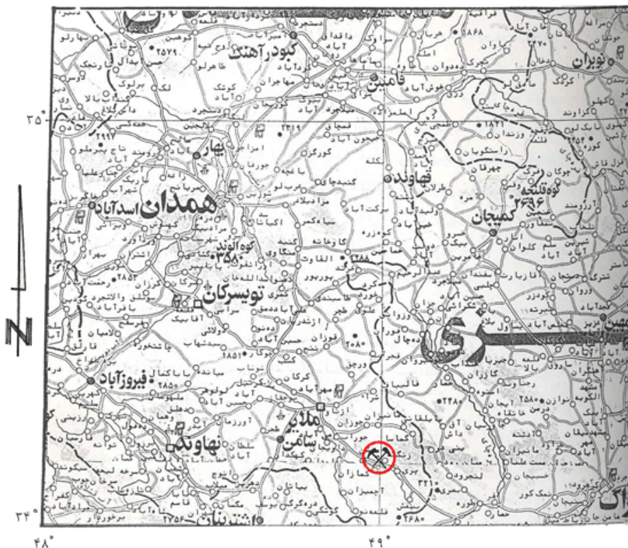
شکل ۱- نقشه موقعیت جغرافیایی معدن سرب و روی آهنگران

لازم به توضیح است که به علت شرایط نامناسب خاک در مناطق آلوده، استقرار و رشد گیاهان با مشکل مواجه می باشد (۲). به این دلیل، شناسایی گونه های مناسب گیاهی که شرایط سخت محیط را تحمل نموده و توانایی زیادی برای جذب و انباشت فلزات سنگین داشته باشند، در افزایش کارایی روش گیاه پالایشی تاثیر مهمی دارد. بررسی پوشش گیاهی در مناطق معدنی و تعیین غلظت فلزات سنگین در آن ها می تواند در شناسایی گونه های ابرانباشتگر مفید واقع شود. هدف اصلی این تحقیق، بررسی غلظت نیکل در تعدادی از گونه های طبیعی غالب در اطراف معدن سرب آهنگران واقع در جنوب شرقی استان همدان است.