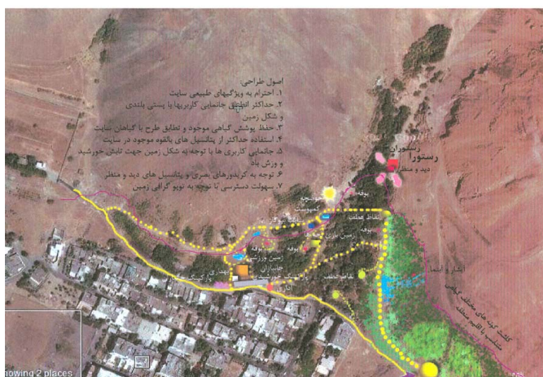
شکل ۶- نقشه طراحی شماتیک پارک انرژی طراحی شده در بوستان نیلوفر