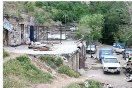
شکل ۱- تصاویر پارک نیلوفر منطقه رحمان آباد قبل از طراحی و ساخت پارک انرژی