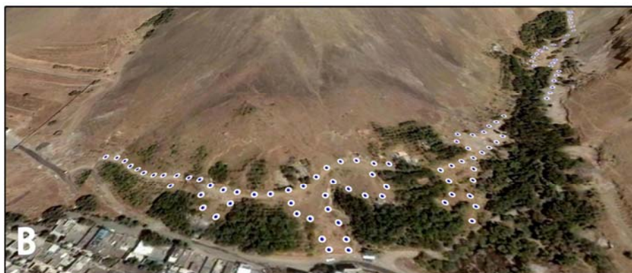
شکل ۴- مسیر طراحی شده جهت استقرار چراغ های خورشیدی در پارک نیلوفر

احداث پارکینگ خورشیدی با ظرفیت پاسخ گویی به نیاز تعداد مراجعه کنندگان روزانه با توجه به عملکرد اکولوژیکی و آموزشی پارک و همچنین استفاده کودکان و جانبازان از پارک در نظر گرفته شده است که پاسخ گوی نیازهای آتی پارک نیز باشد. پارکینگ سایبانی خورشیدی به منظور تامین انرژی پاک برای فضای باز محوطه پارک طراحی شده است. آن ها به صورت سایه بان های مجزا با قابلیت تولید انرژی الکتریکی و تامین روشنایی در ساعات تاریکی کاربرد دارند. بدین صورت که علاوه بر تولید سایه با تولید انرژی پاک در رفع آلودگی هوا تاثیر به سزایی خواهند داشت و همچنین این امکان را فراهم می کند