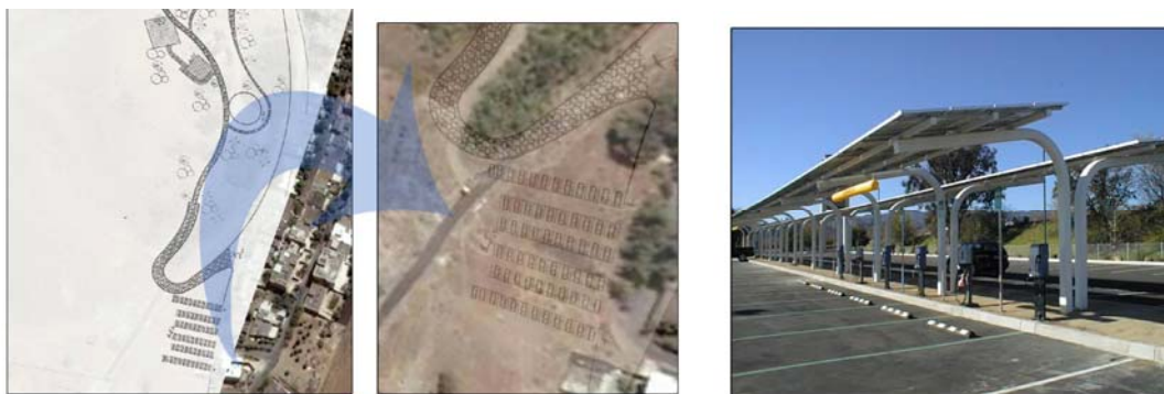
شکل ۵- طرح پارکینگ سایبانی خورشیدی با گنجایش ۶۰ دستگاه خودرو