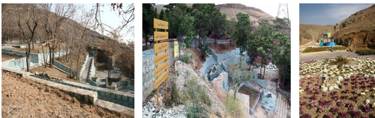
شکل ۷- تصاویری از احداث پارک انرژی نیلوفر