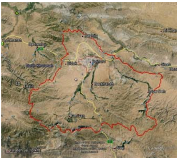
شکل ۱- حوضه آبخیز شهری بجنورد

ابنیه اصلی و مهم شهر همچون مجتمع‌های دانشگاهی و بیمارستان‌ها در بخش جنوبی شهر، عمارت مفخم و آبنه‌خانه در مرکز شهر، استادیوم ورزشی و فرودگاه بجنورد در شمال غرب محدوده شهر و همچنین شهرک‌های صنعتی در غرب شهر واقع شده‌اند. بیشترین میزان ترافیک در خیابان‌های طالقانی و امام خمینی و بلوار نیروگاه است که در جهت شرقی غربی گسترش یافته‌اند و از مرکز ثقل شهر عبور می‌کنند (۷).