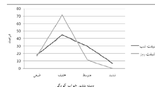
نمودار ۲- مقایسه‌ی خواب‌آلودگی در دو شیفت ثابت صبح و شیفت در گردش شب