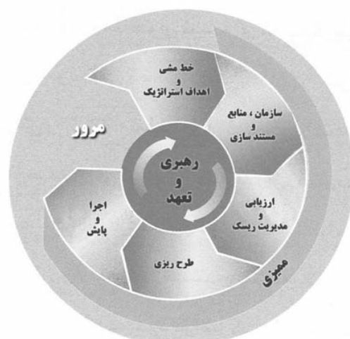
شکل ۱- مدل رایج HSE-MS