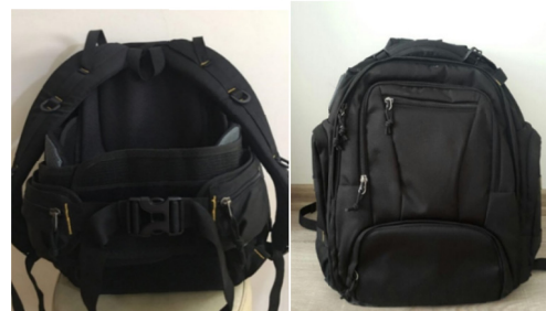
شکل ۱- کوله پشتی جدید ارگونومیک طراحی و ساخته شده