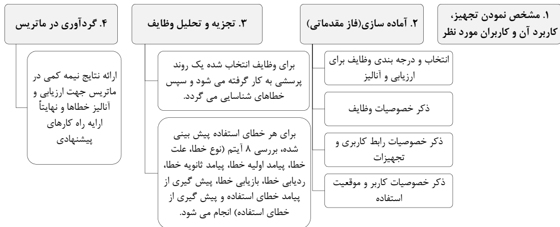
شکل (۱) - الگوریتم مراحل روش PUEA