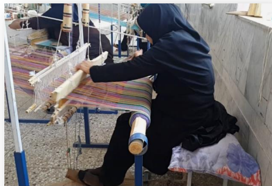
شکل ۱: ایستگاه کاری کاربافی

کد اخلاق این مطالعه IR.SSU.SPH.REC.1396.1 است.