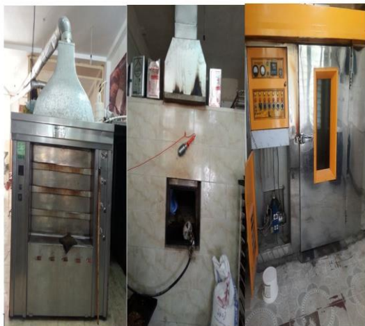
شکل ۲- انواع فرهای قنادی الف: فر طبقه‌ای ب: فر کوره‌ای ج: فر گردان (دوار)

کرد (۲۵، ۲۶). برای تعیین شاخص بهینه هم می‌توان از پارامترهای فیزیولوژیک استفاده کرد که دمای دهانی یکی از پارامترهای مهم برای اعتبارسنجی شاخص‌ها محسوب می‌شود (۲۳).