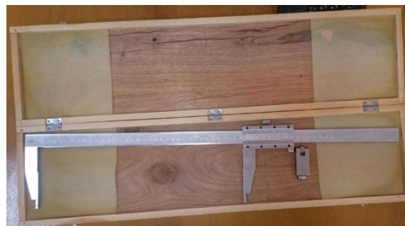
شکل ۱: کولیس آنتروپومتر

تجزیه و تحلیل داده‌ها نیز با استفاده از نرم‌افزار SPSS 17 انجام شد. نرمالیتی داده‌ها با استفاده از آزمون Kolmogorov-Smirnov بررسی گردید و آزمون آماری کای اسکوئر، Fisher ، T ، Mann-Whitney و آمار توصیفی در سطح