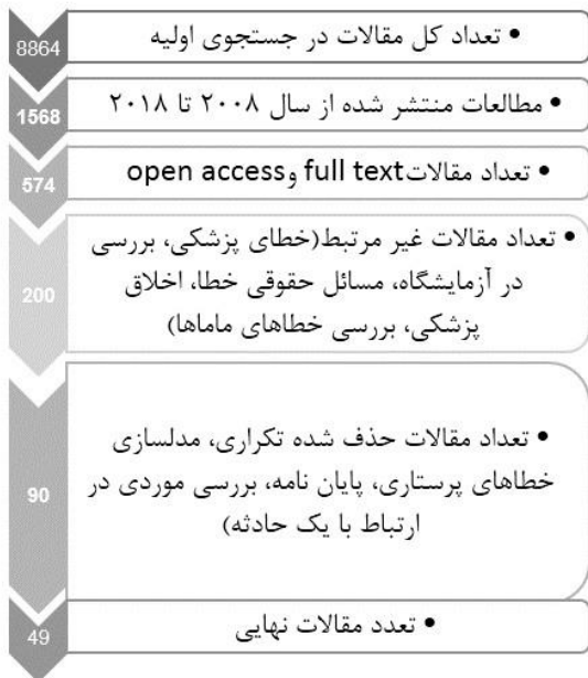
شکل ۱. نحوه انتخاب مقالات در پایگاه‌های داده

عملکردی، بازیابی، بازدید، ارتباطی و انتخابی اشاره کرد که در این روش در تمام طول فرایند تجزیه و تحلیل وظایف شغلی، عمده خطاهای خارجی و خطاهایی با مکانیسم روان‌شناختی را می‌توان تشخیص داد. در این مطالعه انواع خطا براساس طبقه‌بندی روش SHERPA مطالعه شده است.