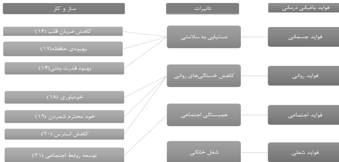
شکل ۱- ارتباط بین فواید باغبانی درمانی با تاثیرات و ساز و کار آن