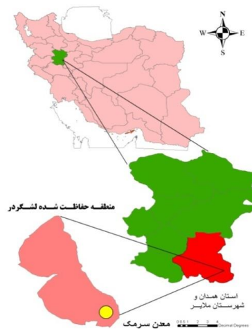
شکل ۱- نقشه موقعیت جغرافیایی معدن آهنگران نسبت به منطقه حفاظت شده لشگردر، شهرستان ملایر، استان همدان و کشور

و پوست تخم خود برخی از فلزات را دفع می کنند، به عنوان مثال پرندگان دریایی فلزات را در غلظت هایی چند برابر میزان موجود در آب، انباشت کرده و سبب بزرگ نمایی زیستی در موجودات می گردند (۱۳). لذا آلوده شدن آن ها قادر است بیماری ها و یا فلزات سمی را به مردمی که از آن ها مصرف می کند انتقال دهد (۱۴). پرندگان می توانند سطوح بالایی از فلزات را درون بافت های خود از جمله کبد و کلیه و پر نگهداری کنند (۱۵ و ۱۶). کادمیوم عنصری فلزی و نرم به رنگ سفید مایل به آبی است که در مجاورت هوا تیره می شود. کادمیوم مانند سرب یک عنصر غیر ضروری است و به دلیل سمیت بالا و پایداری آن در غذا و در محیط زیست به عنوان یکی از خطرناکترین فلزات سنگین توصیف شده و ممکن است اثرات شدیدی بر موجودات زنده (میکروارگانیزمها، گیاهان و جانوران) داشته باشد. غلظت بالای کادمیوم در پر به شدت با کاهش نرخ رشد استخوان در ارتباط است (۱۷). اثرات سمی کادمیوم در پرندگان شامل کاهش تولید تخم، آسیب کلیوی، آسیب به بیضه و تغییر واکنش رفتاری است (۱۸). بنابراین می توان نتیجه گیری نمود که تجمع فلزات در بافت های پرندگان بیشتر از محیط اطراف است هر چند که اثرات جغرافیایی را نمی توان نادیده گرفت (۱۹). در این بررسی، گونه کبک