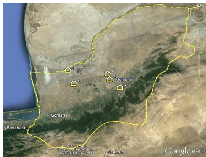
شکل ۳- موقعیت گزینه های پیشنهادی دفن زباله و احداث کارخانه کمپوست در استان گلستان

از نظر فنی، در نهایت دو کارخانه کمپوست هر یک با ظرفیت ۲۵۰ تن در یک نوبت کاری و با خط تولید کودهای درشت و نرم در دو سایت، در بخش های شرقی و غربی استان استقرار خواهند یافت (۱۲). شکل ۳ موقعیت گزینه های پیشنهادی را در استان گلستان نشان می دهد.