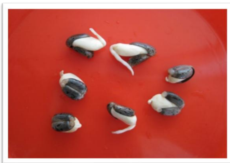
شکل ۱- جوانه زنی بذر کرچک پس از ۴۸ ساعت

با محیط و آلاینده های خاص، عاملی حیاتی جهت موفقیت فن آوری گیاه پالایی محسوب می شود. در این تحقیق در گام نخست با مطالعات کتابخانه ای و جمع آوری مقالات مرتبط با موضوع پژوهش گونه گیاهی مناسب پالایش متفورمین هیدروکلراید تعیین گردید. Ricinus communis (کرچک) گیاهی است یک ساله، دوساله و پایا، علفی با درختچه های پرشاخ و برگ، به ارتفاع ۱ تا ۵ متر. ساقه آن تقریباً همیشه ضخیم، سبز متمایل به کبود یا متمایل به قهوه ای و پر شاخه است. برگ: غالباً بزرگ و وسیع، متناوب، دارای دم برگ بلند، گاهی با تقسیمات پنجه ای، دارای ۵ تا ۷ تقسیم یا بخش سر نیزه ای- دنداندار، با گوشوارک های چسبنده به هم. گل کرچک تک جنس، کوچک، سبزفام، دارای کاسه ای با ۳ تا ۵ تقسیم، فاقد دیسک و گلبرگ، مجتمع در خوشه های مرکب در کنار برگ ها یا در انتهای ساقه، گل های پایینی گل آذین نر، دارای پرچم های فراوان با میله های متعدد که در پایین به