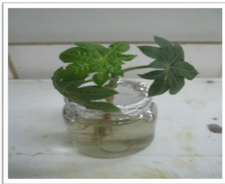
شکل ۶- پالایش متفورمین هیدروکلراید توسط Ricinus communis از محلول متفورمین هیدروکلراید پس از ۱۴ روز Figure 6. Remediation percent of metformin hydrochloride contaminated solutions by Ricinus communis , after 14 days.

محلول یا پساب منتقل شود. لازم به ذکر است که نحوه استقرار صحیح گیاهان متضمن تداوم رویش آن هاست. بنابراین سعی بر آن بوده که گیاه در طول دوره رویش کمترین تنش را داشته باشد و هنگام قرار دادن گیاه در محلول، دور ظروف را با پلاستیک تیره پوشانده تا از نفوذ نور و آسیب به ریشه جلوگیری به عمل آید. در آزمایش مورد نظر این تحقیق، گیاهان Ricinus communis پس از شستشو در آب مقطر داخل شیشه های حاوی متفورمین هیدروکلراید قرار گرفتند تا پتانسیل گیاه برای جذب مورد بررسی قرار بگیرد. (شکل ۶) اما اگر پالایش حجم زیادی از پساب مورد نظر باشد، طراحی سیستمی برای خروج گیاهان از بستر شن ضروری است که باید در مطالعات بعدی مورد بررسی قرار گیرد.