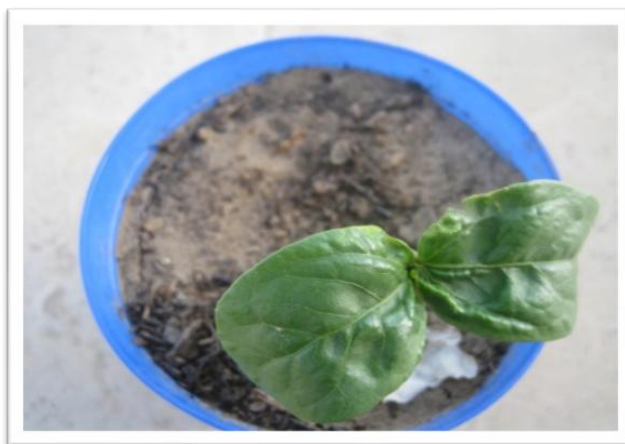
شکل ۲- استقرار بذر کرچک و مراحل ابتدایی رشد در خاک