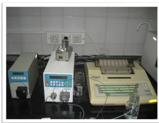
شکل ۳- نمای کلی از دستگاه HPLC و مشتقات آن Figure 3. Overview of HPLC and its derivatives

HPLC از دو فاز ثابت و متحرک تشکیل شده است، که فاز ثابت ممکن است جامد و یا مایع باشد و فاز متحرک مایع است. HPLC بدون شک، سریع‌ترین رشد را در بین تمام روش‌های جداسازی تجزیه‌ای با فروش سالانه در گستره میلیارد دلار داشته است. دلایل این رشد انفجارآمیز عبارتند از حساسیت روش، سازگاری سریع آن برای انجام اندازه‌گیری‌های کمی صحیح، شایستگی آن برای جداسازی مواد گونه‌های غیرفرار یا ناپایدار در مقابل گرما و مهم‌تر از همه، کاربرد گسترده آن برای موادی است که در صنعت، زمینه‌های مختلف علوم و جامعه در درجه اول اهمیت قرار را دارند. مزیت کروماتوگرافی نسبت به ستون تقطیر این است که به آسانی می‌توان به آن دست یافت. با وجود این که ممکن است چندین روز طول بکشد تا یک ستون تقطیر به حداکثر بازده خود برسد، ولی یک جداسازی کروماتوگرافی می‌تواند در عرض چند دقیقه یا چند ساعت انجام گیرد. یکی دیگر از مزایای برجسته روش‌های کروماتوگرافی این است که آن‌ها آرام هستند، به این معنی که