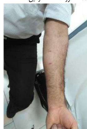
شکل ۴- نحوه پیدا کردن عضله خم کننده انگشتان دست

از یک ماژیک علامت گذاری شد (شکل ۴). برای پیدا کردن عضله‌ی باز کننده مچ دست (شکل ۵) از افراد خواسته شد مچ دست خود را بالا و پایین بیاورند با انجام این کار عضله منقبض و قابل رؤیت بود و این ناحیه نیز توسط ماژیک علامت گذاری شد.