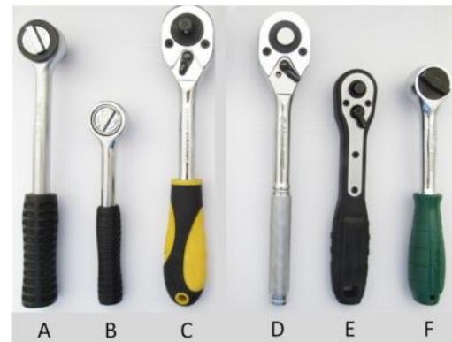
شکل ۱- آچاربکس‌های مورد بررسی در مطالعه

گرفته و فعالیت خود را جهت باز کردن پیچ و مهره‌ها انجام دهند. در این مرحله هر فرد شش بار و هر بار با یکی از آچاربکس‌ها پیچ‌ها را باز می‌کند. ترتیب انتخاب شش مدل آچاربکس برای هر فرد به صورت تصادفی در نظر گرفته شد. مراحل اجرای وظیفه شبیه سازی شده شامل الف) انتخاب بکس مناسب، ب) وصل کردن بکس به دسته بکس، ج) تنظیم سوئیچ باز و بسته کردن، د) باز کردن پیچ و مهره‌ها از صفحه کار بود (شکل ۳). فواصل زمانی استراحت بین انجام فعالیت با آچاربکس‌های متفاوت در حدود ۵ دقیقه بود و داده‌های مربوط به فعالیت الکتریکی عضلات در هنگام کار با هر کدام از شش مدل آچاربکس ثبت گردید. سپس با در نظر گرفتن اینکه متغیرهای مستقل و وابسته بررسی شده هر دو کمی می‌باشند برای بررسی ارتباط دو متغیر کمی از آزمون رگرسیون خطی استفاده گردید و داده‌ها با نرم افزار آماری SPSS نسخه ۲۱ تجزیه و تحلیل شدند