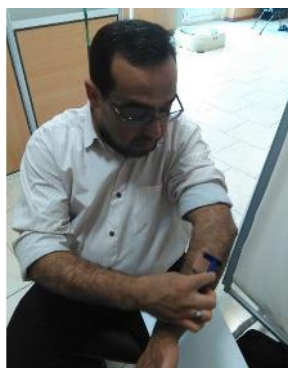
شکل ۶- آماده سازی پوست برای ثبت سیگنال