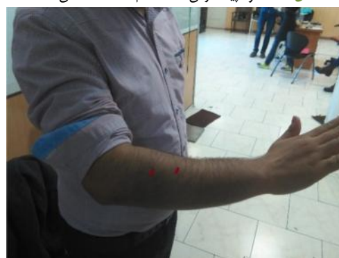
شکل ۵- نحوه پیدا کردن عضله باز کننده مچ دست

میانگین سن، قد و وزن افراد شرکت کننده در