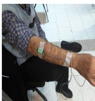
شکل ۷- نحوه اتصال الکتروود در عضلات خم کننده انگشتان و بازکننده مچ دست