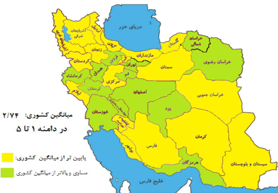
شکل ۱- توزیع سرمایه اجتماعی در استان‌های ایران نسبت به میانگین کشوری

که در نتایج مربوط به آن به مقدار سرمایه اجتماعی در بین کارکنان اشاره‌ای نشده است. مطابق نتایج تحقیق نام‌برده، سرمایه اجتماعی بر سرمایه فکری تأثیر معناداری دارد. پژوهشی که در سال ۲۰۱۸م بین کارگران ۵ کارخانه در شهر بابل گویای این بوده که میانگین امتیاز سرمایه