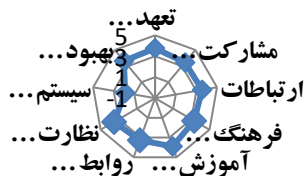
شکل ۳- میانگین امتیاز سازه های بخش فاکتورهای سازمانی ابزار

نمره فاکتور \times بار وزنی) \Sigma = نمره شاخص عملکرد ایمنی (نمره فاکتور محیطی) 0.173 + (نمره فاکتور فردی) 0.324 + (نمره فاکتورهای سازمانی) 0.503 = نمره شاخص عملکرد ایمنی