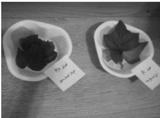
تصویر ۱- نمونه‌های مربوط به قبل و بعد اعمال دود،

جهت اندازه‌گیری سولفات و نیترات جذب شده توسط بافت گیاهی نمونه‌های جمع آوری شده به مدت ۲۴ ساعت در آن ۷۰ درجه سانتی‌گراد قرار داده شد. سپس نمونه‌های خشک شده به صورت پودر درآمده و در ظرف‌های جداگانه با برچسب a (نمونه شاهد) و b (نمونه بعد از اعمال دود) نگه‌داری شد. ۲۵۰ میلی‌گرم از هر نمونه با ۲۰۰ میلی‌لیتر آب مقطر مخلوط شد و به مدت ۲۴ ساعت در آن نگه‌داری شد. سپس مخلوط حاصل از صافی عبور داده شد. ۱۰ میلی‌لیتر از این مخلوط برای آزمایش اندازه‌گیری سولفات معادل ۱۰۰ میلی‌لیتر رقیق گردید. برای اندازه‌گیری نیترات ۵ میلی‌لیتر از محلول اولیه تا میزان ۵۰ میلی‌لیتر رقیق گردید. در نهایت غلظت سولفات و نیترات به روش جذب یو-وی توسط اسپکتروفوتومتر ۲ سنجیده شد.