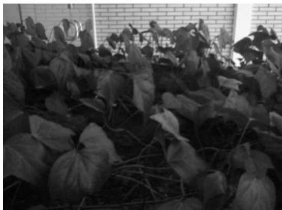
تصویر ۲- محدوده گیاه پایتال

سبزی می‌توانند بهبود دهنده میزان پایداری در فضاهای شهری از طریق کاهش آلودگی هوا باشند" و اگر پاسخ این سوال آری است این امر چگونه و به چه میزان رخ می‌دهد. هدف از انجام این پژوهش، اثبات و بسط فرضیه بالا در دو مرحله است. در مرحله نخست تمرکز پژوهش بر این است که آیا دیوارهای سبز با پوشش گیاهی خود می‌توانند آلاینده‌های موجود در هوا را جذب نمایند. در مرحله دوم، بررسی‌ها برای تعیین میزان این اثر جذب‌کنندگی است. بر اساس فرضیه مطرح شده، این پژوهش بر آن است تا میزان جذب آلاینده‌های ناشی از سوختن بنزین توسط خودروها در سطح شهر توسط دیوارهای سبز را با آنالیز شیمیایی یک نمونه پوشش گیاهی به انجام رساند. بدین ترتیب با انجام آزمایش‌های پیش رو، مشخص می‌شود که آیا می‌توان دیوارهای سبز را به عنوان راه‌حلی برای کاهش حضور آلاینده‌های ناشی از وسایل نقلیه به‌شمار آورد یا خیر.