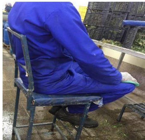
شکل ۱: صندلی‌های قبل از مداخلات ارگونومیکی

درد در ناحیه کمر و زانو داشتند (به دلیل شیوع زیاد درد در این دو ناحیه)، به شکل هدفمند به‌عنوان نمونه آماری انتخاب شدند (۱۶ نفر گروه تجربی و ۱۶ نفر گروه کنترل). معیارهای ورود عبارت بود از: ۱. نداشتن شغل دوم، ۲. علت اختلالات مرتبط با کار کارخانه باشد، ۳. داشتن سابقه حداقل یک سال [۲۴].