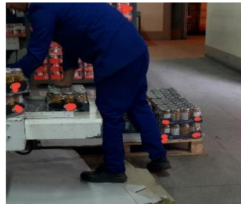
شکل ۳: ایستگاه کاری جای‌گذاری بارها در جعبه‌های بزرگ