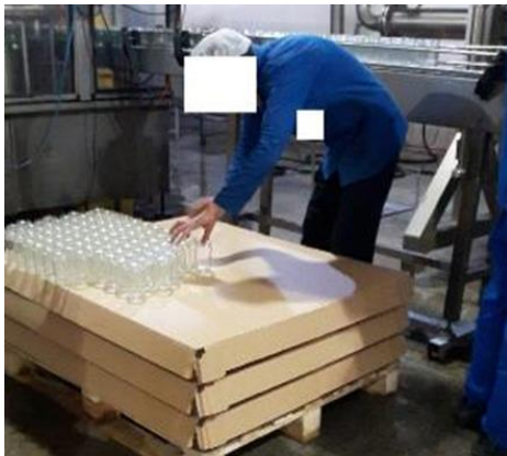
شکل ۴: ایستگاه کاری جای‌گذاری قوطی‌ها در نوار بسته‌بندی