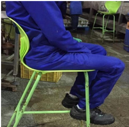
شکل ۲: صندلی‌های بعد از مداخلات ارگونومیکی