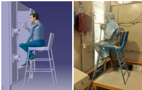
شکل ۱: پوسچر واقعی کارگر و مدل دیجیتالی در نرم‌افزار کتیا

امتیاز نهایی ارزیابی پوسچر پاشش رنگ پیش از مداخله و به روش رولا، ۷ و قرمز رنگ بود؛ یعنی بررسی و تغییرات فوری در پوسچر مدنظر لازم است. همچنین در این پوسچر، وضعیت ساعد، عضلات، مچ و بازو، پا، بالاتنه و گردن در سمت راست و چپ بدن قرمز رنگ بود (جدول ۱)؛ بنابراین، با در نظر گرفتن اصل کاهش