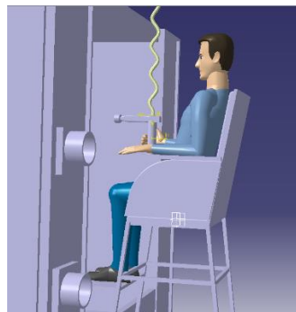
شکل ۲: شبیه‌سازی ایستگاه کاری پیشنهادی در محیط کتیا

جزئیات ایستگاه کار را قبل از ساخت ارزیابی کرد [۳۸]. تغییر زاویه در مفاصل مدل شبیه‌سازی شده در محیط نرم‌افزار نشان داد با حفظ عملکرد و حدود دسترسی می‌توان سطح ریسک را تا حد زیادی کاهش داد [۳۹]. همچنین در خصوص اصلاح ایستگاه کاری تحقیقات مشابهی انجام شده است [۴۰-۴۲]. Swinton و همکاران در مطالعه‌ای که به منظور ارزیابی اثربخشی مداخله ارگونومی در طراحی صندلی انجام دادند، به این نتیجه رسیدند که سطح خطر پس از مداخله به صورت معنی‌داری کاهش یافته است [۴۳]. در مطالعه Gonen و همکاران نیز مونتازژ در نرم‌افزار کتیا طراحی شد و بعد از ساخت آن به جای دو مونتازژ کار، به یک نفر نیاز بود. در نتیجه زمان تولید ۶۰ درصد کاهش یافت و کارگر دوم می‌توانست در میز دیگری کار کند [۲۰].