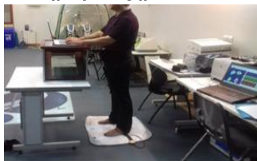
شکل ۱. ارزیابی فشار کف پای بر روی کفپوش ارگونومیک

شرکت کنندگان آموزش داده شد که به صورت عادی بایستند، از محیط تعیین شده خارج نشوند، به میز تکیه ندهند و همچنین برای حمایت وزن بدن با دست به میز تکیه ندهند. در ادامه افراد شرکت کننده شروع به تایپ کردن به عنوان یک وظیفه شغلی سبک شدند و در ۳۰ ثانیه پایانی فشار میانگین نقاط آناتومیکی ذکر شده ثبت شد. البته برای جلوگیری از خستگی افراد و همچنین کاهش خطا در ثبت نتایج فشار کف پا در کفپوش بعدی، شرکت کنندگان به مدت ۳۰ دقیقه استراحت می‌کردند، تمام شرکت کنندگان در طول آزمون پابرهنه بودند. برای تجزیه و تحلیل داده‌های گردآوری شده از نرم‌افزار spss نسخه ۲۰ استفاده شد. روش‌های آماری مورد استفاده در