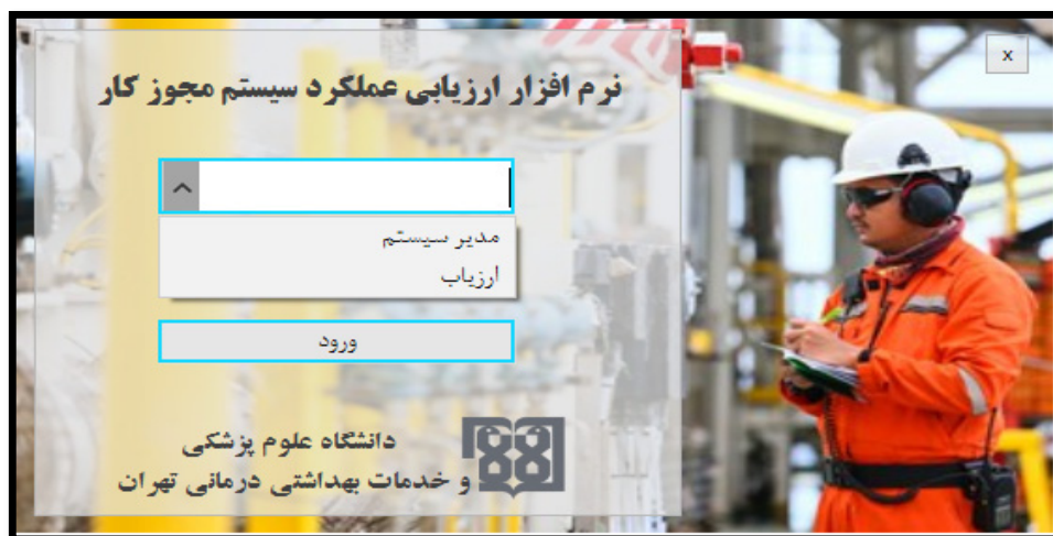
شکل ۲. صفحه اصلی ورود به نرم‌افزار و انتخاب نوع سطح دسترسی

جهت ایجاد یک ارزیابی را در بخش مدیریت سازمان نرم‌افزار تعریف می‌کند.